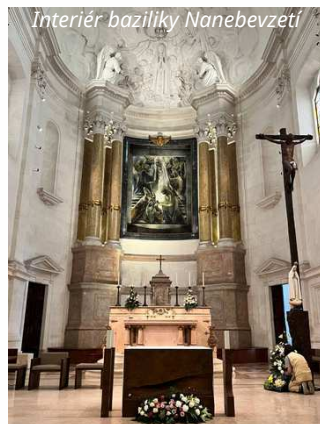
Interiér baziliky Nanebevzetí