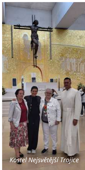
Kostel Nejsvětější Trojice