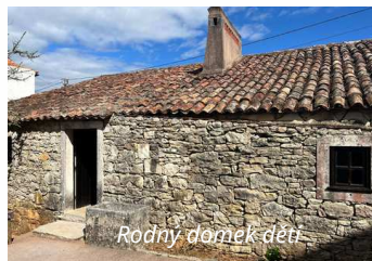
Rodný domek děti