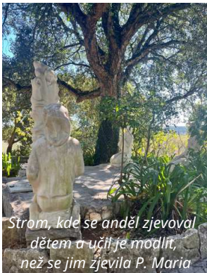
Strom, kde se anděl zjevoval dětem a učil je modlit, než se jim zjevila P. Maria