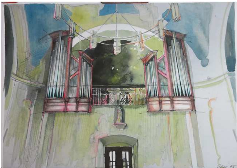
Vítězný návrh varhan od varhanářské dílny Dlabal-Mettler