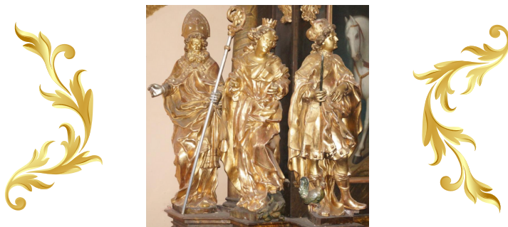
Trojice svatých pomocníků sv. Diviš, Markéta a Vít na oltáři třebotovského kostela vlevo dole.

Bolí vás hlava? Zkuste si prostudovat životopis sv. Diviše . Spolehlivost některých údajů z jeho života je sporná vzhledem k vyskytujícím se záměnám s dalšími světci téhož jména žijících v různých dobách. My máme ale na mysli to nejstaršího, jmenoval se Dionýsius Areopagita, česky nazýván sv. Diviš. Málokterý pro nás známý světec se setkal se svědectvím o víře a vzkříšení Krista přímo od apoštolů Petra a Pavla. Najdeme o něm zmínku v Novém Zákoně v knize Skutky apoštolů. Svatý Diviš se narodil v Athenách vznešeným rodičům, a protože se chtěl vzdělávat ve hvězdářství, byl vyslán rodiči do Egypta. Legenda praví, že na jeho cestách, když Božský Spasitel na kříži umřel a slunce se zatmělo, pravil Diviš ke svému druhovi Apolonovi: „Zdá se, že se ukáže nové světlo – buď trpí původce přírody, nebo svět hyne.“