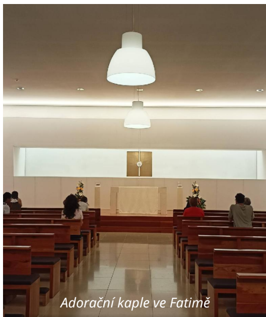
Adorační kaple ve Fatimě