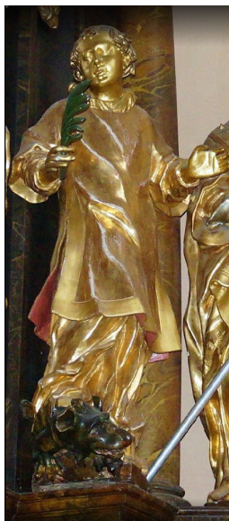
sv. Cyriak + 8.8.309