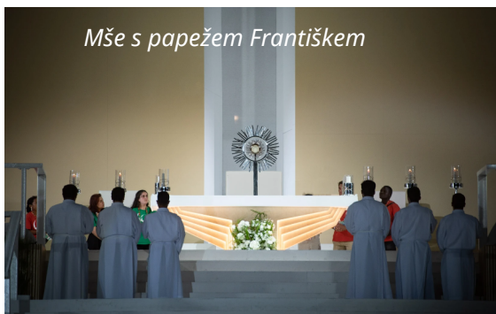
Mše s papežem Františkem