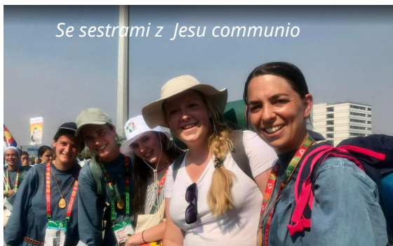
Se sestrami z Jesu communio